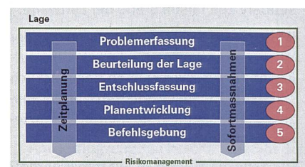
Führungstätigkeiten 7 Bilder: Reglement FSO 17

schwert die Verständlichkeit und führt dazu, dass das Risikomanagement auf den Leser wie ein Fremdkörper wirkt. Im Rahmen der Sofortmassnahmen wird das Risikomanagement nicht erwähnt. Dabei wird verpasst, dass gerade durch das rasche Erkennen von Risiken und Chancen sowie die folgende Umsetzung von wirkungsvollen Sofortmassnahmen wesentlichen Lageverbesserungen erzielt werden können. Dies kommt daher, dass die Führungstätigkeiten vor dem Hintergrund der Aktionsplanung und nicht der Aktionsführung beschrieben werden. Die Tatsache, dass die Führungstätigkeiten die