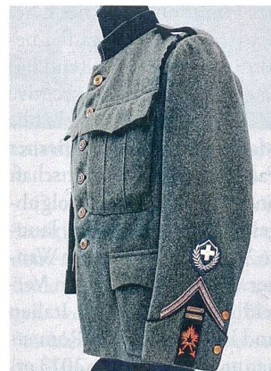
Waffenrock eines Wachtmeisters der Scheinwerfer Pioniere Ordonnanz 1914/17.

Das Werk wird eröffnet mit einer Gesamtschau zur Entwicklung des Unteroffiziers von der Antike bis zur Gegenwart. Zwei Beiträge befassen sich mit der Entwicklung in der Schweiz von 1798 bis heute, einerseits mit Aufgabe, Stellung und Auswahl der Unteroffiziere und andererseits mit den Uniformen und Gradstrukturen. Den Küchenchefs und Fourieren ist ebenso ein besonderer Artikel gewidmet wie auch dem Feldweibel. Weitere besondere Ein-