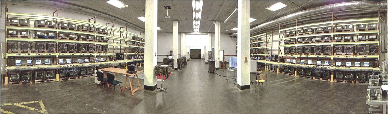
Verifikationsumgebung in einer ehemaligen Lagerhalle in Rümlang: Hier sind militärische Testprozesse auf engstem Raum möglich.

vertreter und unterstützt die FUB fachtechnisch bei der Erstellung der militärischen Pflichtenhefte und Einsatzkonzepte. Im Rahmen des Rüstungsablaufs unterstützt das Kdo FU SKS zudem die armasuisse bei der Evaluation von Telematik- und IT-Systemen, es leitet entsprechende Truppenversuche und beantragt die Truppentauglichkeit. Das Kdo FU SKS ist nicht «Beschaffer», unterstützt den Beschaffungszyklus aber «militärisch». Es begleitet zudem das Lebenswegmanagement von bereits eingeführten Systemen (vgl. Infobox).