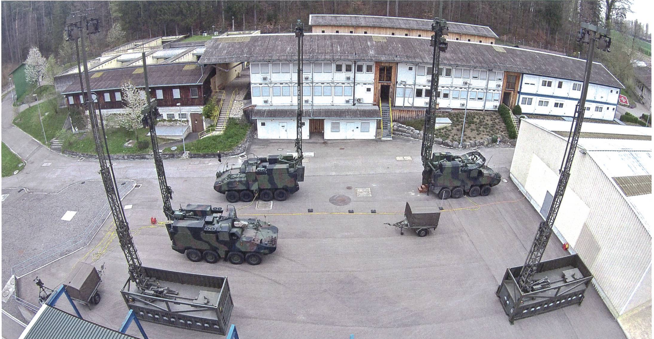
Modernste Mittel zur Führungsunterstützung werden für die Miliz in Rümlang getestet.

chenden Zertifikate des Schweizerischen Verbandes für Weiterausbildung (SVEB) gefordert. Für Spezialisten der Führungsunterstützung aus der gesamten Armee führt das Kdo FU SKS zudem jährlich rund 150 Kurse in den Bereichen IMFS, Funk, Bedienung KOMPAK-, RAP-, Komm Panzer durch.