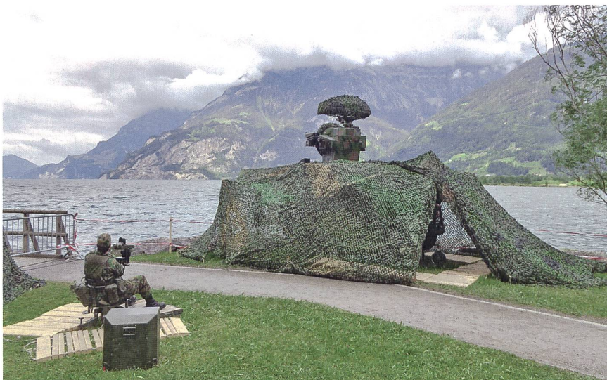
Ein Feuerleitgerät der nördlichen Feuerinheit SKY im Raum Seedorf.

Für GOTTARDO wurden pro Einsatzraum zwei Flab Kan 63/12 in einer Feuerinheit zum Schutz der Festivitäten eingesetzt, was dem ordentlichen Mittelansatz von je einer M Flab FE entspricht. Damit konnte die notwendige Redundanz geschaffen werden, um die technisch bedingten Kontrollintervalle bei einem Geschütz durchzuführen und gleichzeitig die