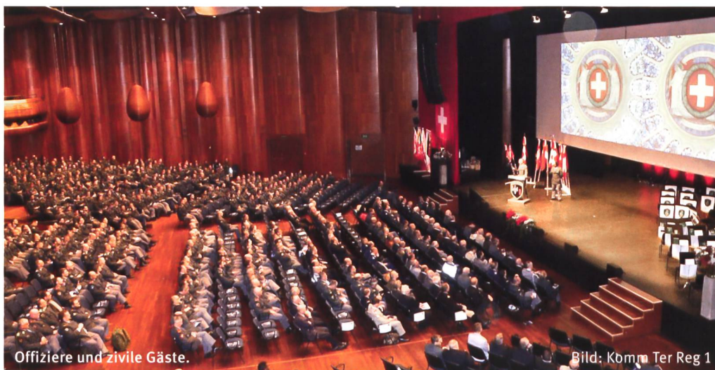
Offiziere und zivile Gäste.

Nach Grussbotschaften des Syndic von Montreux und von Regierungsrätin Béatrice Métraux (VD) folgte ein kurzer Rückblick auf die Dienstleistungen 2017 durch Langel. Kurz deshalb, weil der noch verantwortliche Kdt der Ter Reg 1, Divisionär Favre, ganz bewusst auf eine Teilnahme am Rapport verzichtete. Er wollte damit das Zeichen setzen, dass es nun weiter gehen und man nach vorne schauen