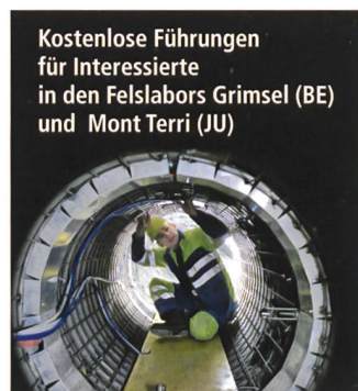
Kostenlose Führungen für Interessierte in den Felslabors Grimsel (BE) und Mont Terri (JU)

ten, forscht die Nagra zusammen mit anderen Nationen in zwei Felslabors in der Schweiz, welche von Gruppen jederzeit kostenlos besucht werden können.