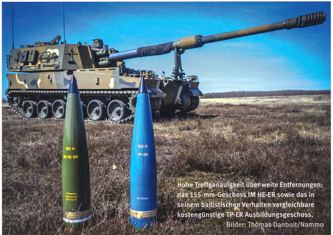
Hohe Treffgenauigkeit über weite Entfernungen: das 155-mm-Geschoss IM HE-ER sowie das in seinem ballistischen Verhalten vergleichbare kostengünstige TP-ER Ausbildungsgeschoss.

Zum anderen müssen weitere technische Entwicklungsmöglichkeiten für die M109 KAWEST als undurchführbar erachtet werden, da die alten Komponenten des Geschützes (Triebwerk, Antriebsanlage usw.) Mitte der 2020er Jahre technisch ans Ende ihrer Nutzungsdauer