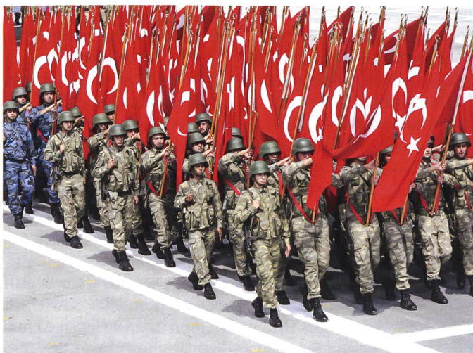
Welche Richtung wird eingeschlagen?

schen Moskau und Ankara laufen seit November 2016. Russland war nie ein grosser Waffenlieferant für die Türkei. Nebst einigen Transporthelikoptern und Schützenpanzern wurde zuletzt im Jahr 2008 in 80 KORNET Panzerabwehrlenkenden Waffen investiert. Als im Jahr 2013 eine Ausschreibung über vier Mia. USD für eine umfassende Boden-Luft-Abwehr lanciert wurde, war Russland zwar Mitbietender, der Auftrag ging letztlich an die Chinesen, welche ihre Fang Dung (FD-2000), dem PATRIOT ähnliche Abwehrraketen, für 600 Mio. USD günstiger offerierten. Die fehlende Kompatibilität mit NATO-Systemen hätte mittels Know-how-Transfer ausgeglichen werden sollen. Aus politischen Gründen wurde dieser Auftrag später gestrichen. Angeblich auf Druck der USA, denn der Chinesische Anbieter CPMIEC (China Precision Machinery Import-Export Corporation) verkauft seine Raketentechnik auch an die von Sanktionen belegten Länder Iran und Nordkorea. Nun zeigt sich Sergei Chemezov, ROSTEC CEO und Verantwortlicher für die S-400-Produktion zuversichtlich. Die Türkei soll so bald als möglich das erste NATO-Land mit seinen Raketen werden.