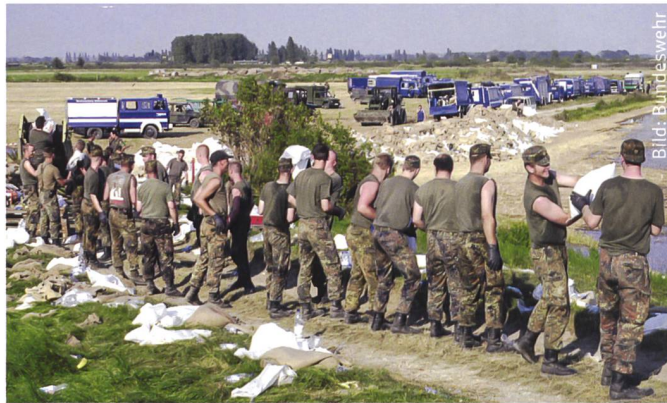
Unterstützung des Zivilschutzes – notwendig, aber nicht NATO-relevant.