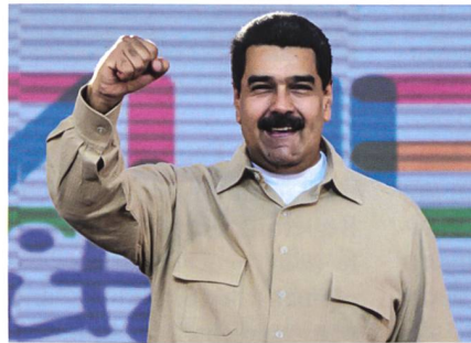
Staatspräsident Nicolás Maduro.

Fake news. Kreise, welche den Präsidenten Maduro unterstützen, werfen der Opposition vor, einen Militärputsch zu organisieren. Das Militär ist fest in der Hand des Staats-