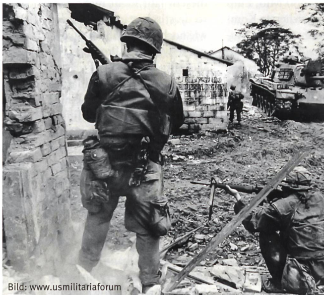
US-Marines während der Tet-Offensive in Hue.

Neben rein humanen Motiven haben wir beim Kampf um (unsere!) Städte noch zwei weitere handfeste Motive, die Zerstörungen auf ein Minimum zu begrenzen: a) Aus Rücksicht auf den späteren Wiederaufbau und b) in Gedanken daran, dass Häuserruinen erfahrungsgemäss dem Verteidiger eine noch bessere Deckung bieten als intakte Gebäudestrukturen.