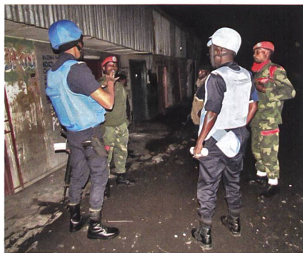
Einsatzbilder UNPOL.

Am Beispiel der DRC ist ersichtlich, dass eine solche Trennlinie jedoch nicht existiert und Armee und Polizei sich ergänzen müssen, um wirksam gegen Kriminelle, Rebellen, Terroristen und Umstürzler vorgehen zu können. Konsequenterweise muss in der DRC die Polizei in der Lage sein, auch schwer bewaffne-