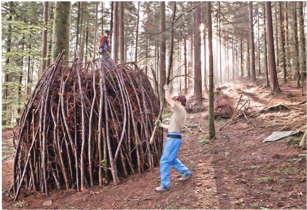
Zivi's im Umwelteinsatz.

Vom Gesichtspunkt der Wehrgerechtigkeit betrachtet, ist der Zivildienst positiv einzuschätzen. Daten aus dem Jahr 2015 zeigen, dass 8% der 30-Jährigen die persönliche Dienstleistung im Zivildienst erbringen, 40% in der Armee; 52% erbringen keine persönliche Dienstleistung. Die Zahlen erhellen, dass der Zivildienst einen Beitrag zur Wehrgerechtigkeit leistet. Dies steht im Einklang mit dem Ursprung des Wortes «zivil», das auf den lateinischen Begriff «civis» zurückgeht, was