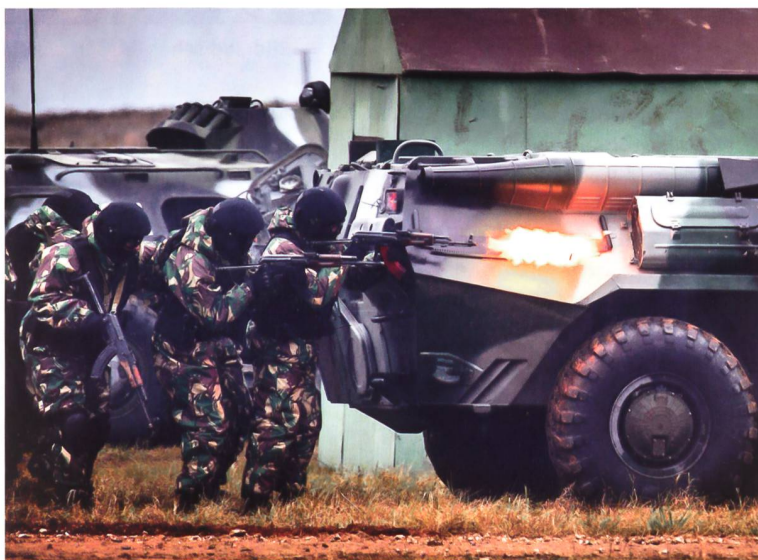
Einsatzübung der Nationalgarde.

Der israelische Geheimdienst Mossad gründete per Juli einen Investment-Fonds, um an neue Technologien zu gelangen. Das unter dem Namen Libertad laufende Projekt sieht vor, unter anderem in Bereiche wie Robotik, Biometrie, Miniaturisierung, Verschlüsselung, Webint (der automatisierten Persönlichkeitserkennung im Internet) und Tarnung zu investieren. Bei der Lancierung des Fonds zeigte sich Mossad Direktor Jossi Cohen zuversichtlich und richtete sich direkt an Firmen und Unternehmen. Die Teilnahme ist weltweit möglich und Ideen mit Potential würden mit bis zu 570000 USD direkt unterstützt. Denn mit diesem Fonds für Technologie und Innovation, so Cohen, gelingt es dem Mossad ideal, seinen Platz zwischen verdeckten Operationen und der offenen Technologiewelt zu finden. Gleichzeitig soll Libertad auch als Netzwerk, respektive Austauschplattform für Marktführer, Unternehmer, Firmen, Industriezweige und Forschungsinstitute dienen. Primäres Zielpublikum bleiben jedoch innovative Start-up-Unternehmen. Deren Ideenpool beabsichtigt der Mossad gezielt anzuzapfen, indem vor Ort Forschung und Entwicklung finanziert werden. Im Gegenzug erhält der Top-Geheimdienst neuste Technologien für seine Ope-