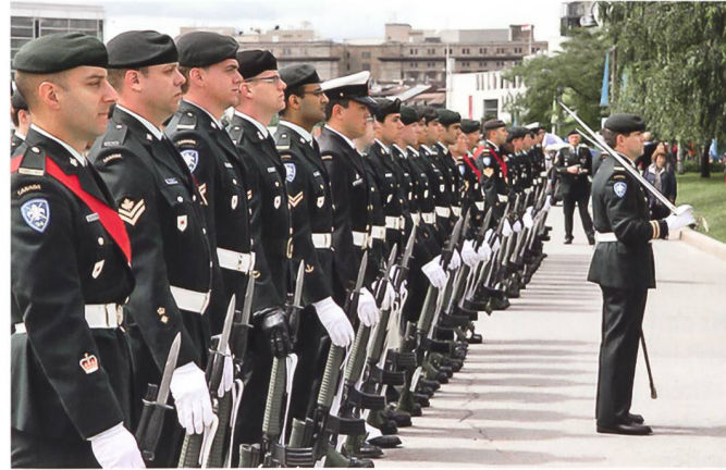
Canada Day Military Parade.

Auch Vertreter der Ureinwohner sind eher unzufrie-