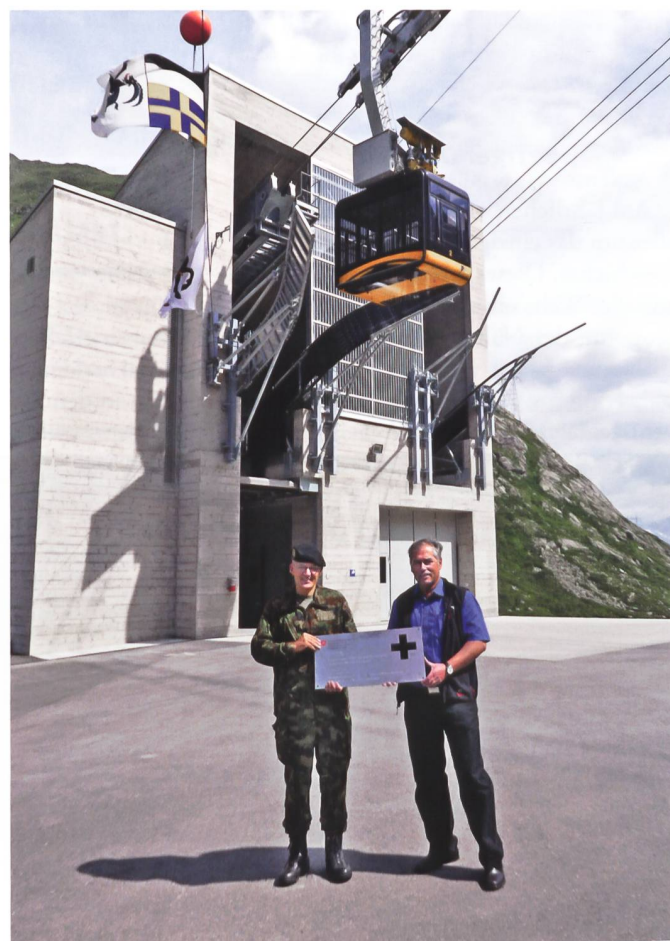
C FUB, Div Theler und der Chef der Betreiber Mannschaft vor der Talstation.

Während vier Jahren Bauzeit unter teilweise extremen und gefährlichen Bedingungen an der Wetterscheide und auf grosser Höhe ist eine neue, mit zeitgemässer Technik ausgestattete Anlage entstanden.