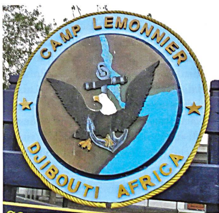
Signet der US Basis «Camp Lemonnier».

kulturelle Projekte wie die Eröffnung des Konfuzius-Instituts haben Präsident und Bevölkerung Djiboutis «wohl» gestimmt. Das kleine Land und seine 900 000 Einwohner profitieren von der Entwicklung zum internationalen militärischen Drehkreuz. Präsident Ismael Omar Guelleh konnte seit seiner Machtübernahme 1999 Djibouti politisch, auch dank der Mieteinnahmen für Militärbasen, stabilisieren. Eine an sich schon bemerkenswerte Leistung in einer Region, in der Nachbarstaaten wie Somalia und Jemen implodieren. Guelleh erkannte früh, dass er aus der Verpachtung von Basen an interessierte Nationen die eigene Staatskasse krisensicher auffüllen konnte. Die Zusammenarbeit mit den westlichen Nationen gewährte ihm darüber hinaus auch einen gewissen Schutz vor der öffentlichen Kritik an seinem autoritären Führungsstil. So schwieg die internationale Presse, als