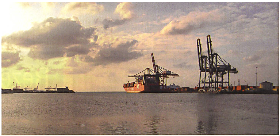
Containerhafen in Djibouti.

Doch obwohl Peking weiter offiziell von einer «non-intervention»-Politik spricht, kann die neue chinesische Militärstrategie als eine Abkehr vom Prinzip der Nicht-einmischung in die inneren Angelegenheiten anderer Staaten angesehen werden. Floss bislang lediglich Geld (und Arbeiter) in afrikanische Infrastruktur- und Bodenschatzprojekte, so entsandte Peking