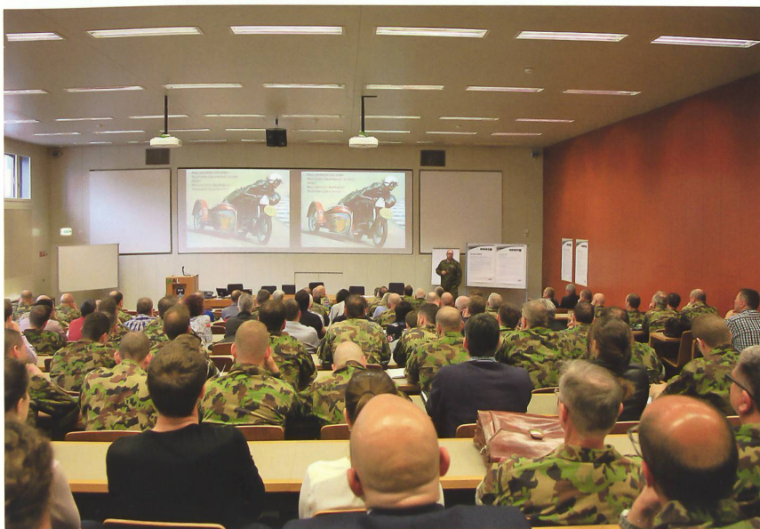
Lehrkörperausbildung HKA 2018: eine Investition in die hohe Qualität der Führungsausbildung, analog zur perfekten Teamarbeit der Rennfahrer. Bild: HKA

Umfragen haben gezeigt, dass die Teilnehmenden ein attraktives Programm wünschen, das ihnen Informationen gibt, sie anregt und nicht zuletzt auch Kameradschaft erfahren lässt. Die Zeiten, als grosse Stäbe zur Bearbeitung von ope-