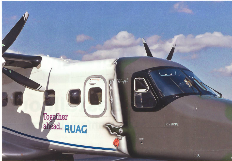
Dornier 228 an der Luftfahrzeugausstellung ILA.

Die angedachte Entflechtung sieht vor, eine «RUAG Schweiz» und eine «RUAG International» (beides Arbeitstitel) unter dem Dach einer neuen Beteiligungsgesellschaft zu bilden. In der «RUAG Schweiz» sollen alle Leistungen für die Schweizer Armee zusammengefasst werden (in erster Linie für Wartung, Reparatur und Überholung = MRO). Dies entspräche primär den beiden bisherigen Divisionen RUAG Aviation und RUAG Defence. Zählt man deren Umsatzvolumen zusammen, so ergäbe sich ein Betrag von rund 900 Mio. CHF. Die RUAG beziffert die Leistungen der Materialkompetenzzentren für die Schweizer Armee und damit für die neue «RUAG Schweiz» jedoch auf bloss rund 400 Mio. CHF. Dies bedingt folglich keine «artreinen» Umorganisationen einzelner Divisionen, sondern stets neue Schnittstellen und Verschiebungen. Der deutlich überwiegende Rest der heutigen RUAG, namentlich der internationale und der «nicht sicherheitsrelevante Bereich» (unter anderem Cyber!), würden in