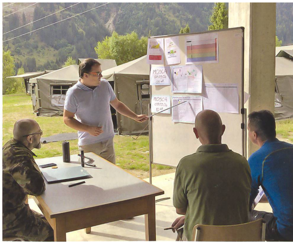
Stabsarbeit heisst auch: Präsentieren von Resultaten.

Der Kurs folgt einem etablierten Modell: Durch praktische Übungen lernen und militärische Entscheidungsprozesse anwenden. Am ersten Tag wird mit Hilfe eines Krisenszenarios, das durch die Schliessung einer wichtigen Verkehrsachse unseres Landes verursacht wird, das Wissen über die ersten drei Phasen der 5+2 Methode (Problemerkennung, Beurteilung der Lage, Entschlussfassung) ver-