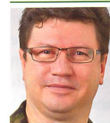
Korpskommandant Aldo C. Schellenberg Chef Kommando Operationen / Stellvertreter Chef der Armee 3003 Bern

Die im Rahmen der WEA neu konzipierte Mobilmachung hat zum Ziel, die zivilen Behörden bei nicht vorhersehbaren Ereignissen innerhalb von zehn Tagen mit bis zu 35 000 AdA zu unterstützen, respektive bei Bedarf die gesamte Armee aufbieten zu können. Damit dies möglich ist, müssen die Mobilmachungsprozesse regelmässig trainiert werden. Dabei dienen die Mobilmachungsübungen dazu, die relevanten Prozesse bei der Truppe als Standardverhalten zu implementieren. ■