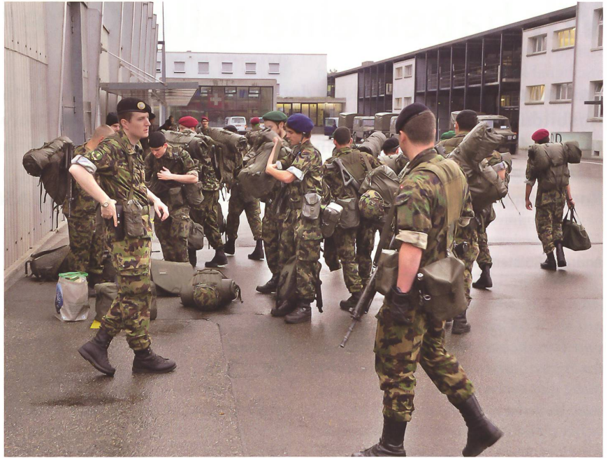
Einrücken auf dem Mob Platz.

Die Prozesse der Mobilmachung sind – aufgrund der bisher kurzen Umsetzungsphase – in ihrer Gesamtheit bei der Truppe noch nicht gefestigt. Zwar ist beispielsweise der Ablauf zur Entgegennahme der Ausrüstung bekannt, jedoch haben die Fassungsorte teilweise geändert. Dies ist für die Truppe genauso gewöhnungsbedürftig wie auch der Ablauf unter Zeitdruck, da eine Staffellung der Fassung unter Mobilmachungsbedingungen nicht mehr möglich ist. Damit diese Abläufe