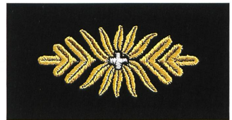
Versuchstyp einer Blattrosette für Kragenspiegel Gst Of, Ordonnanz 1949.

Historischer Reiseführer 200 Jahre ZS/HKA: Details unter: www.armee.ch/200-jahre-zs . Die Kapitel können als PDF heruntergeladen oder beim Kdo HKA in Printversion bezogen werden.