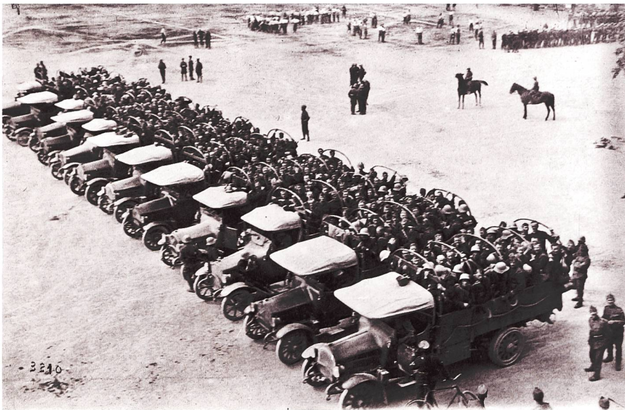
Bereit! Motoren! Abmarsch!

Gewehrkolben werden die Füße der Demonstranten geschlagen. Flinke, unbewaffnete Soldaten stürmen in die Menge und holen die aufgeregtsten Teilnehmer heraus.