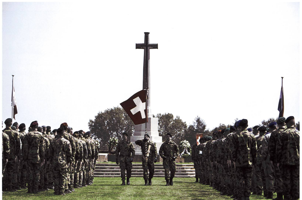
Das Schweizer Marschbataillon bei der jährlichen Kranzniederlegung auf dem kanadischen Soldatenfriedhof in Groesbeek.

Wenig später beginnt der Ausmarsch. Musikalisch wird er von der Heeresmusik Ulm begleitet. Im Gleichschritt marschiert das 155-köpfige Bataillon an den gigantischen Stiefeln vorbei, welche den Ein- bzw. Ausgang zum Camp dominant markieren. Dann kehrt die angenehme Ruhe zurück. Die ersten 850 Meter marschieren die Militärs durch einen zum 600 Hektar grossen