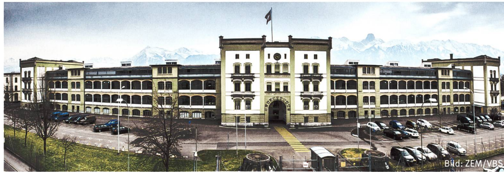
Thun Mannschaftskaserne (MK I).