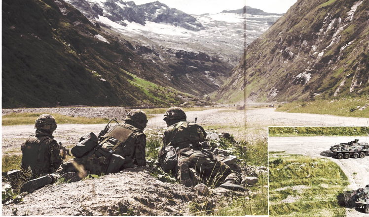
Infanteristen während eines Gefechtssexerzierens.

war es, rasch auf unterschiedliche Lageentwicklungen reagieren zu können. So musste das Kader etwa darauf gefasst sein, Grundentschlüsse laufend anzupassen und Eventualplanungen durchzuführen.