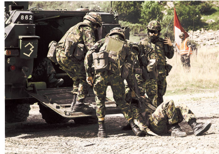
Kameradenhilfe während eines Gefechtschiessens.

merkte diesbezüglich: «Meine Elemente erkunden die definierten Marschachsen. Die Späher überwachen den Einsatzraum und geben Meldungen schnell und in hoher Qualität an die Führung weiter.»