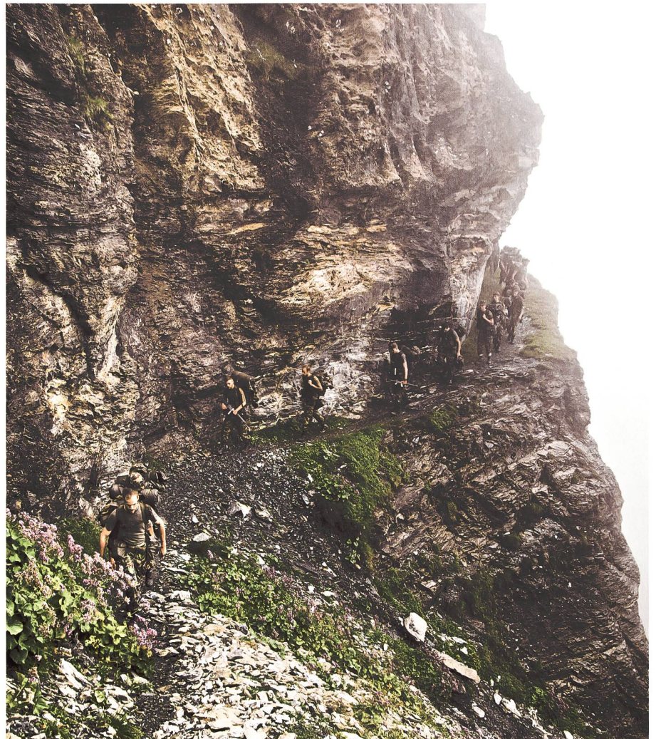
Am Panixerpass.

Ein Blick in den Übungsverlauf der Geb Inf Kp 91/3 zeigt eindrücklich auf, aus welchen Elementen «EDELWEISS» bestand: In einer ersten Phase ging es darum, per Fussmarsch von Pigniu auf den Panixerpass zu gelangen. Auf der Passhöhe angelangt, berichtete der Alpin Of, Hptm Philipp Kleger, in packenden Worten vom russischen Generalissimus, Ale-