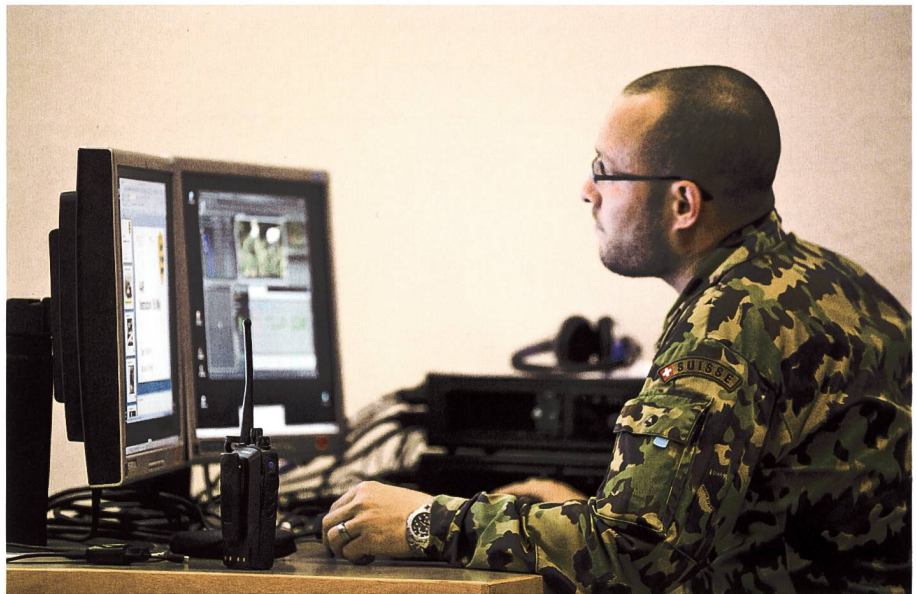
Elektronische Unterstützung der militärischen Ausbildung – bald auch von zu Hause aus.

Vom zeitlichen Aufwand sollte sich für die Auszubildenden eine grössere Flexibilität ergeben, da sie den Zeitpunkt eines Teils ihrer Ausbildung selber bestimmen können. Mental und zeitmanagementmässig erhöhen sich die Ansprüche an die