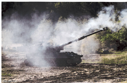
Verteidigung setzt zwingend schwere Kampfmittel voraus, hier Pz Hb M-109.

Der BBT geht davon aus, dass das Konfliktumfeld hybrid sein wird und konventionelle gegnerische Kampfverbände am Boden an vielen Orten rasch in überbauten Gelände stossen werden (BBT, S. 80). Bodentruppen müssten daher laut BBT ihre Aufgabe in einem hybriden Konfliktumfeld, in überbautem Gebiet und inmitten der Zivilbevölkerung erfüllen, weshalb ihre Weiterentwicklung darauf auszurichten sei (S. 15). Auf Kampf- und Schützenpanzer (Waffensysteme der Kategorie 1; siehe BBT, S. 107) würde zugunsten leichter, gepanzerter Radfahrzeuge verzichtet (S. 115). Krieg besteht aber nicht nur aus Verteidigung, sondern auch aus Angriff.