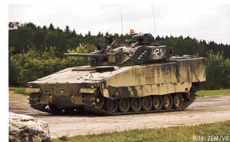
Verteidigung setzt zwingend schwere Kampfmittel voraus, hier Spz 2000, CV-90.

Carl von Clausewitz schreibt dazu: Ein schneller, kräftiger Übergang zum Angriff – das blitzende Vergeltungsschwert – ist der glänzendste Punkt der Verteidigung; wer ihn sich nicht gleich hinzudenkt, oder vielmehr, wer ihn nicht gleich in den Begriff der Verteidigung aufnimmt, dem wird nimmermehr die Überlegenheit der Verteidigung einleuchten [...].