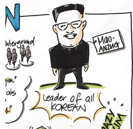
Abb.1: Kim Jong-un und sein Korea (Detail aus Abb.3).

und, viel entscheidender, die Kim-Dynastie stärken (Abb.1). Die drei interkoreanischen Gipfeltreffen im Jahr 2018 sowie die ebenfalls 2018 erstellte Panmunjom «Declaration for Peace, Prosperity and Reunification of the Korean Peninsula» sind erste Zeichen für eine Wiedervereinigung nordkoreanischer Prägung. Die internationalen Drohungen, die machtpolitischen Manöver und die Nuklearstrategie sind in diesem Zusammenhang eigentlich nur Begleiterscheinungen. Was sind die Beweggründe, die einen solchen