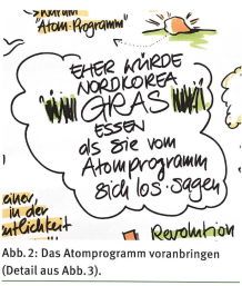
Abb. 2: Das Atomprogramm voranbringen (Detail aus Abb. 3).

Pjongjangs Strategie einer Nordkoreanischen Moderne als Leitkultur ist in diesem Sinne beste Symbolpolitik und eine gute Projektionsfläche für das südkoreanische Volk. Südkorea ist ein Land, welches lange von der Globalisierung profitieren konnte und nun durch Handelskriege (u.a. mit Japan) deren Kehrseite zu spüren bekommt.