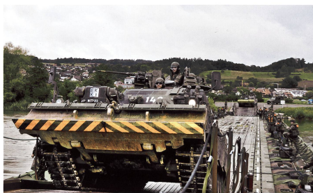
Ein Bergepanzer Büffel (65t) überquert bei Rottenschwil AG die Reuss über eine Schwimmbrücke 95. Im Hintergrund ein Pionierpanzer Kodiak.

Sämtliche Brücken, welche in der Sap Kp 1 sowie in den beiden Pont Kp 2 und 3 eingeteilt sind, haben mindestens eine