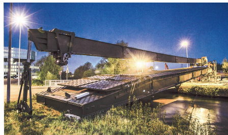
Nächtlicher Einbau einer 36 m langen Unterstützungsbrücke.

vier Rampen eine Brücke von 100 m Länge und einer Fahrbahnbreite von 4,2 m bauen. Alternativ kann mit den Pontonmodulen auch ein Fahrbetrieb aufgezogen werden, mit welchem ebenfalls schwere Kampfpanzer oder Panzerhaubitzen übersetzt werden können. Dieses moderne französische Brückensystem besteht durch seine rasche Einwasserung ab Lastwagen. Die Pontonelemente gleiten ab den Fahrzeugen direkt ins Wasser. Im Gegensatz dazu braucht die französische