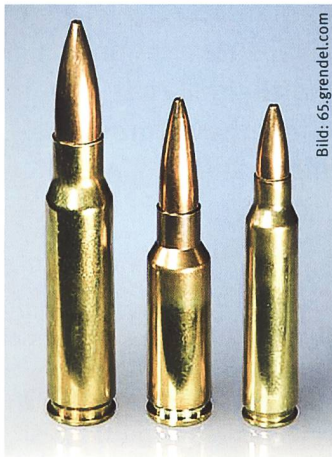
Grössenvergleich der Patronen, v. l. n. r.: 7,62 × 51 mm NATO, 6,5 mm Grendel und 5,56 × 45 mm NATO.

schlecht beherrschbar sind. SCHV-Munition hat sich im Einsatz nicht bewährt, die Wirkung im Ziel ist nicht ausreichend. Bei einer Sturmgewehr-Neubeschaffung soll neben der Waffe auch eine neue Patrone evaluiert werden. Um für eine bestimmte, durch ballistische Überlegungen gegebene Lauflänge eine möglichst kompakte Waffe zu bauen, ist die Bullpup-Konfiguration einer konventionellen Konstruktion vorzuziehen. ■