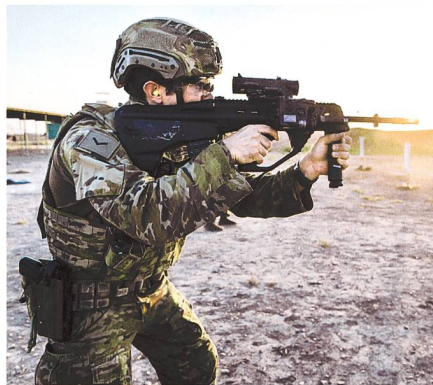
Australischer Soldat mit Bullpup-Sturmgewehr EF88 «Austeyr» im Irak.

schosse haben aber auf diese Distanz eine ungenügende Wirkung. Zudem sind sie sehr sensibel gegen Windeinfluss. Das Problem wird verschärft, wenn Waffen mit gekürzten Läufen und demzufolge reduzierter Mündungsgeschwindigkeit eingesetzt werden. Die mangelnde Wirkung auf Distanzen jenseits von 300 m wurde bereits nach dem Golfkrieg kritisiert. 4 Im Kampf gegen Aufständische im Irak bewährten sich im Häuserkampf kompakte Waffen wie der M4 Karabiner. Aber auch auf die kurzen Schussdistanzen wurde, wie bereits nach dem Einsatz in Somalia 1993,