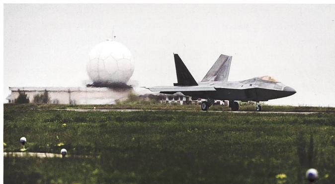
Mihail Kogalniceanu Air Base.

diger Infrastruktur auch Schulen, Kindergärten, Militärhotels und Supermärkte geben, die Gebäudefläche wird auf mehr als 30 Hektaren veranschlagt. Strom wird durch Photovoltaik und einem eigenen Kraftwerk generiert, das gesamte Areal von 76 km Stacheldraht umzäunt. Derzeit ist Mihail Kogalniceanu besonders für die US-Streitkräfte relevant, diese nutzen den Standort als Transitpunkt für ihre Truppen und Waffen, welche in den nahen und ferneren Osten verschoben werden, aber auch als Hub für das in Rumänien stationierte THAAD antiballistische Raketenabwehrsystem. Vor allem