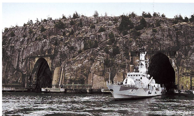
Korvette der Göteborg-Klasse beim Auslaufen auf Muskö.