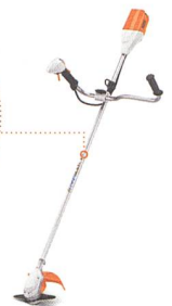
AKKU-MOTORSENSE FSA 90