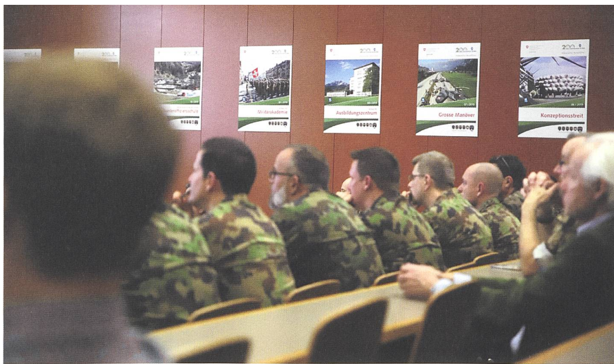
Traditionsanlass HKA 2019: Abschluss der historischen Reise durch 200 Jahre ZS/HKA. Reiseführerkapitel an der Wand.