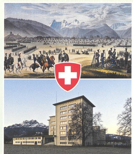
Vielfalt in der Einheit.

Zum Jubiläum sollte etwas Bleibendes geschaffen werden. Nachdem mit den Büchern «Kaderschmiede – Kaderschule» (1994) und «Führen lernen in der Armee» (2013) viel Vorarbeit geleistet wurde, konnte gut abgesichert etwas Neues gewagt werden. Der historische Reiseführer bot die chronologische und inhaltliche Klammer im Jubiläumsjahr. Er zeichnet die Geschichte der Höheren Kaderausbildung der Armee seit der Gründung der Eidgenössischen Central-Militärschule von 1819 auf. Die dreizehn Kapitel erheben keinen Anspruch auf Vollständigkeit. Sie sollen alle Interessierten auf eine spannende Zeitreise mitnehmen – und allenfalls zum Weiterlesen anregen. In Dankbarkeit allen gegenüber, die in den vergangenen 200 Jahren als Kader für unsere Armee gedient haben, die diese ausgebildet und weitergebracht haben. Eine im Grunde genommen glückliche Geschichte. Sie verpflichtet uns alle: Es gibt keine Zukunft in Sicherheit