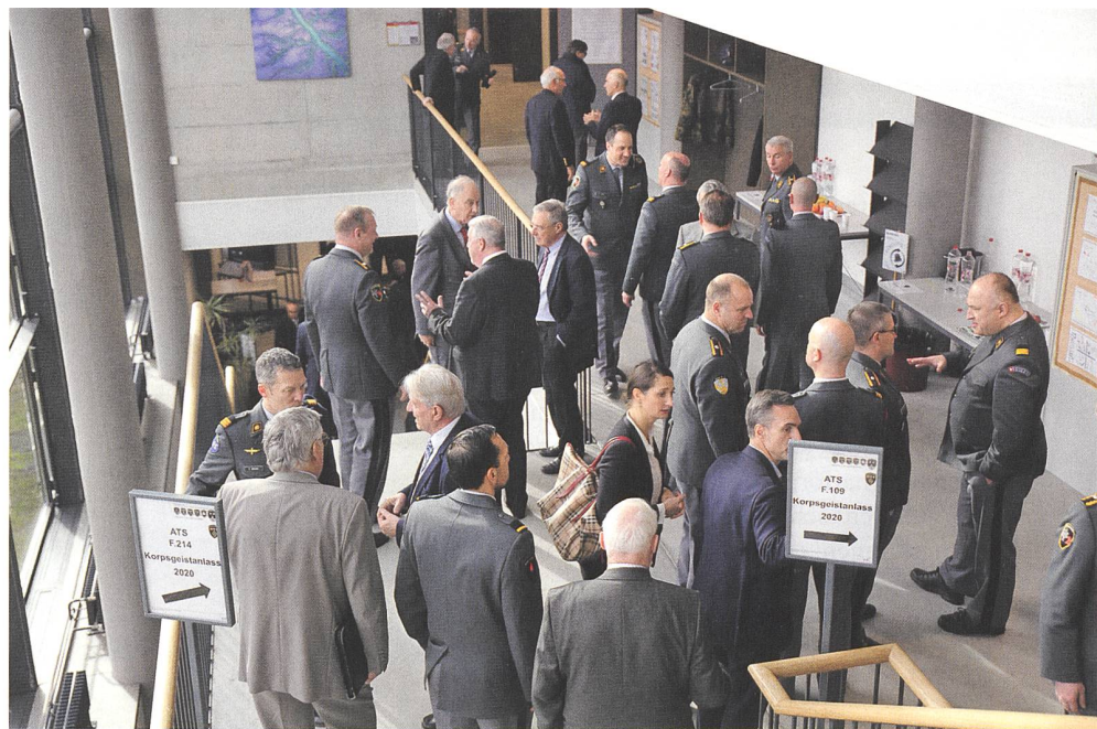
Mit der Generalstabsschule auf Tuchfühlung: ein funktionierendes Netzwerk.

Was haben grosse Cyber-Nationen wie China und Russland uns voraus? Sie setzen Heere von «Cyber-Kriegern» offensiv für wirtschaftliche und politische Ziele ein, verdeckt oder auch offen. Es geht um Wirtschaftsdominanz bei China: Rohstoffe, Know-how, Infrastruktur, letztlich also um garantiertes Wachstum. Es geht um politischen Revisionismus bei Russland: Machtpolitik durch Destabilisierung bis hin zu offener Kriegführung, begleitet von irregulären Kräften, auch im Cyber-Raum. In beiden Fällen, so muss man an-