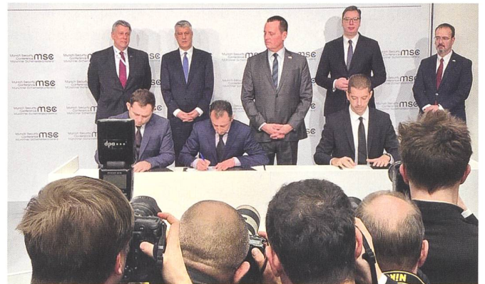
Grenell (Mitte) flankiert von Thaçi, (l.) und Vučić (r.) bei der Unterzeichnung in München.

Feuer zu giessen. Letztmals unter dem Regierungschef Ramush Haradinaj, welcher noch Ende November 2018 100% Zollzuschläge auf sämtliche aus Serbien importierten Produkte erheben liess. Der serbische Präsident Aleksandar Vučić vermeldete deshalb per Regierungserklärung, dass die Transportabkommen äusserst wichtig seien, denn sie regeln den Verkehr von Waren, Kapital und Dienstleistungen. Aber besonders erlauben Sie es der Bevölkerung, sich freier zu bewegen. Die beiden Staatsoberhäupter haben deshalb Mitte Februar anlässlich der Münchner Sicherheitskonferenz und im Beisein des ehemaligen Sondergesandten des US Präsidenten, Richard Grenell, die notwendigen Verträge unterzeichnet. Als Wermutstropfen bleibt, dass die neue, seit Anfang Februar im Amt stehende kosovarische Regierung noch am gleichen Tag die Gültigkeit der Abkommen in Frage stellte. Diese seien nämlich vom ehemaligen