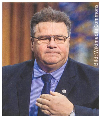
Beunruhigt: Linas Linkevičius.

heit speziell im Baltikum, das nach der Befreiung von den Nazis jahrzehntelang unter dem Eisernen Vorhang litt. In diesem Zusammenhang nannte Linkevičius den Vorschlag