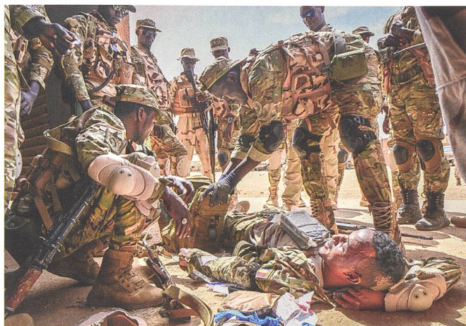
Taktische Wundversorgung im Training, Soldaten aus dem Tschad und Senegal.

hilfe nicht gelöst werden können. Derzeit könne man nur noch dem Beispiel des AFRICOM folgen und die Aggressoren aktiv eindämmen. Dies versucht Frankreich, welches weitere 600 Soldaten in die Region entsendete und damit seine bereits vorhandenen 5100 Kämpfer verstärkt. Bis Ende Sommer sollen weitere 400 Spezialkräfte aus verschiedenen Euro-Ländern im Rahmen von EU-Ausbildungsmissionen eintreffen und die lokalen Streitkräfte für den Kampf gegen Al Qaida, den IS sowie Boko Haram fit machen. Zusammen mit den etwas über 5000 US-Soldaten eine stattliche Anzahl, aber viel zu wenig