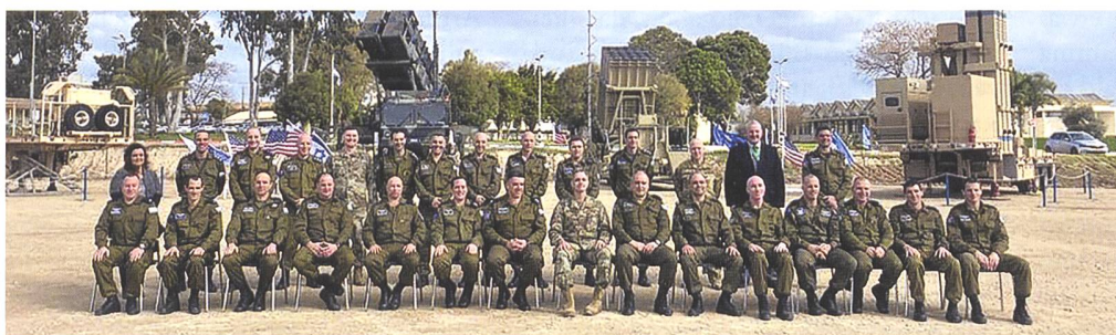
Übungsleitung vor dem IDF Luftabwehr-Arsenal.

den BODLUV-Systemen Arrow 2 und Arrow 3. Zusammen mit einem upgegradeten Iron Dome und der David-Sling standen die fortschrittlichsten Systeme bereit, welche die IDF derzeit zu bieten hat. Zudem kam das «Ballistic Imaging Management Center» zusammen mit dem Homefront Command zum Einsatz. Ersteres unterstützt mittels computerbasierter Bildverarbeitung die forensische Identifizierung von diversen gegnerischen Waffensystemen. Eine gleichzeitig stattfindende Übung namens «Eagle Genesis» wurde aufgrund des Coronavirus abgesagt, laut US-Sprechern aus Vorsicht, da mehrheitlich Truppen aus Italien nach Israel rotiert wären.