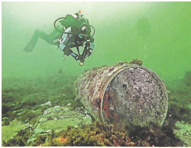
Gefährlicher Tauchgang: Munitionsrest in der Kolberger Heide in der Ostsee.

müssen Fischer ihren Fang aus bestimmten Gebieten auf Gift untersuchen lassen. Vor Danzig sollen noch schätzungsweise 60 Tonnen chemische Stoffe und etliche Schiffswracks liegen. Nicht zu übersehen ist in diesem Zusammenhang, dass die Ostsee nach 1945 ein wichtiges Übungsgebiet des Warschauer Paktes darstellte; erwartungsgemäss sind hierzu nähere Kenntnisse überaus gering.