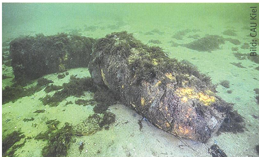
Auf dem Grund von Ost- und Nordsee verrotten 1,6 Millionen Tonnen Kriegsmunition.

Anlässlich der Umweltkonferenz in Hamburg Ende letzten Jahres (2019) wurden Vermutungen geäußert, wonach indes für allein die in deutschen Meeresgewässern befindlichen Munitionsversenkungsgebiete und belasteten Flächen weit höhere Zahlen aufweisen. Vor zwei Jahren