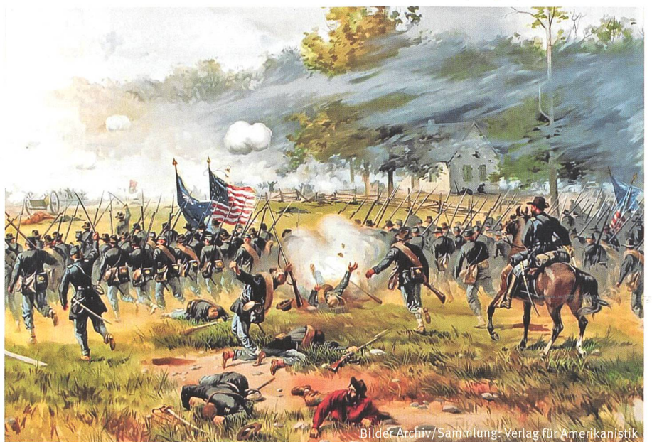
Schlacht bei Mill Springs (KY).