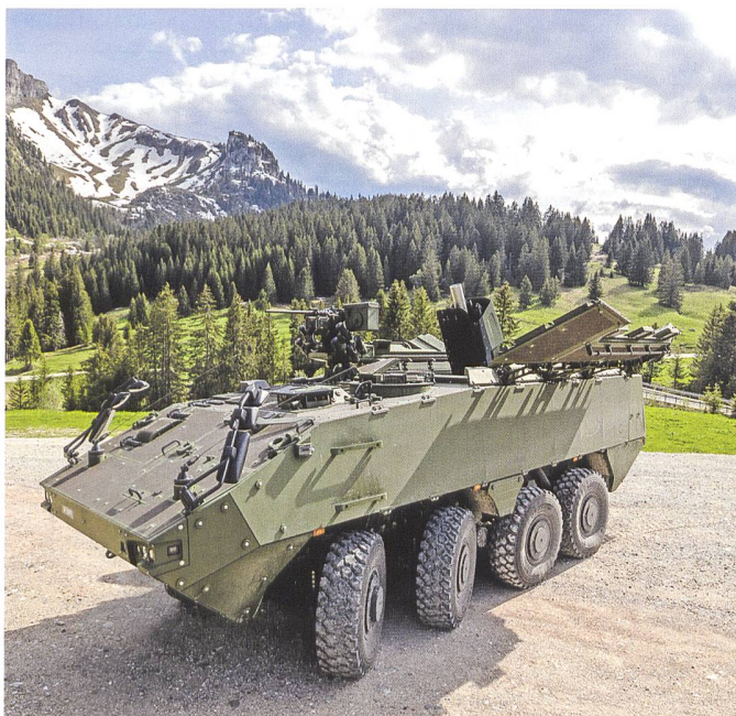
12 cm Mörser 16.

Mit Abschluss dieser Erprobung ist ein entscheidender Schritt in diesem Beschaffungsprojekt erreicht. Die nächsten Schritte sind die Vorbereitung und Unterzeichnung des Serienvertrags. Darin enthalten werden auch die Umsetzung der Erkenntnisse aus den bisherigen Erprobungen durch Industrie, armassuisse und die Truppe sein. Die Übergabe an die Truppe ist geplant ab dem Jahr 2024. dk