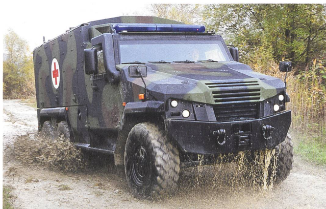
Test des Eagle 6x6 im Gelände.

Mindestens ebenso bedeutend ist ein zweiter Aspekt: Das bestellte Eagle 6x6 Sanitätsfahrzeug wird an GDELS-Standorten in der Schweiz und in Deutschland gefertigt. Bei Mowag werden alle Fahrzeugteile grundfertig; das heisst,