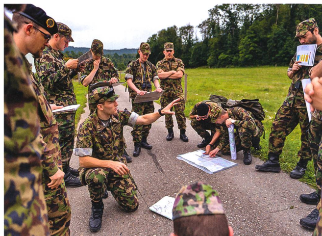
Auf Erkundung im Raum Bülach.