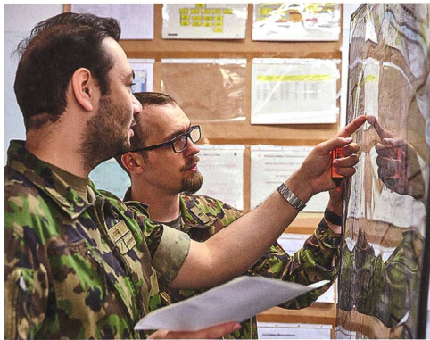
Während der Aktionsplanung (AP) am AAL.

In dieser Woche werden verschiedene Partner der Gruppe Verteidigung in die Ausbildung einbezogen, sei es im Kadervorkurs zur Befähigung des Lehrpersonals oder direkt im Lehrgang in bestimmten Spezialbereichen. Nicht zuletzt bringt dies den Vorteil mit sich, dass sich die doktrinalen Vorgabestellen und die HKA dadurch regelmässig fachlich austauschen und abgleichen. Damit wird die Einheitlichkeit, Durchgängigkeit und Verbindlichkeit der Inhalte in den verschiedenen Fachbereichen gestärkt.