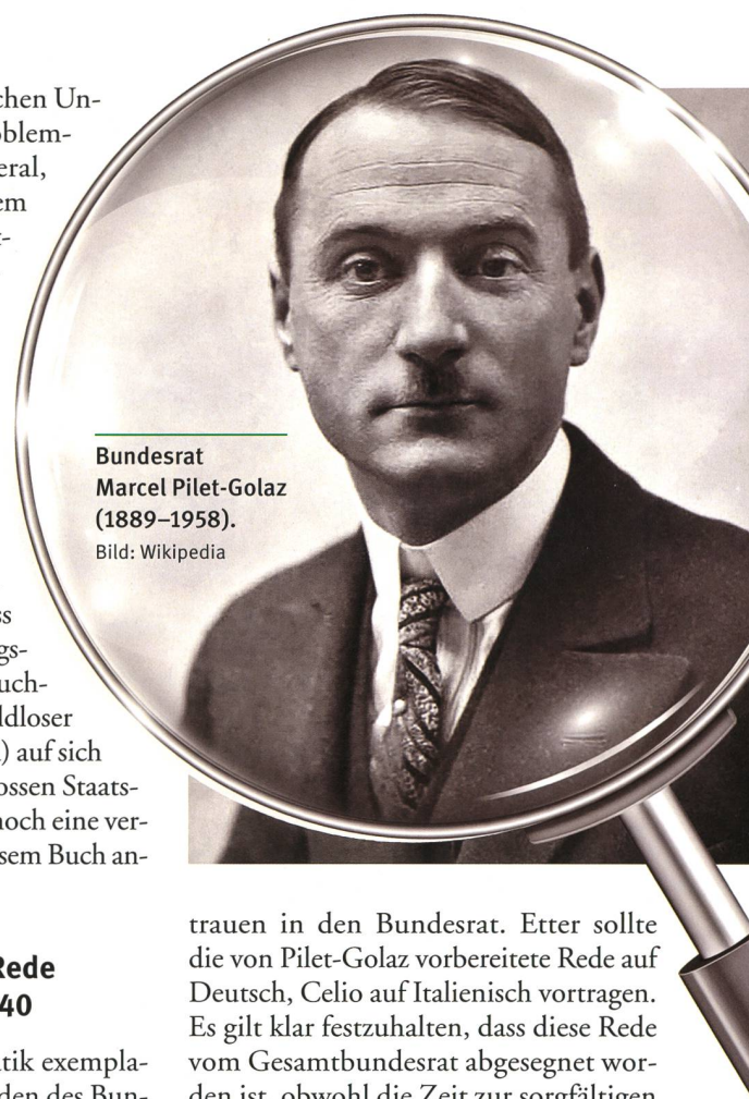
Bundesrat Marcel Pilet-Golaz (1889–1958).

Diese zeigt die Problematik exemplarisch auf: Es gibt wenige Reden des Bundesrates, die Wort für Wort seziiert und so unterschiedlich bewertet worden sind, wie die nach den Mittagsnachrichten vom 25. Juni. Verantwortlich dafür ist Bundespräsident Pilet-Golaz. Er hatte diese Rede schon seit Tagen im Entwurf vorbereitet, wollte sie aber erst am Tag des Waffenstillstands halten. Seine persönlichen, vorbereitenden Notizen zeigen klar, er wollte ein verunsichertes Volk auf schwere Zeiten vorbereiten und ihm Mut machen. Mit den Bundesratskollegen Minger und Etter besprach er am 24. Juni die drei Schlüsselaussagen: Bekämpfung des Defaitismus, Sicherung der Arbeit und Ver-