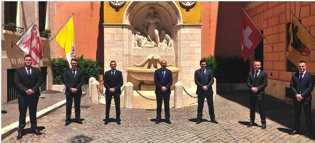
Die Rekruten der Sommer-Rekrutenschule.

Im Herbst verschieben sie sich, zusammen mit der Herbst-RS, auf den Waffenplatz nach Isonne, wo sie bei der Kantonspolizei im Tessin das Sicherheitstraining absolvieren. Folgende Themen werden dabei behandelt: Elemente der Psychologie und des Rechts, Brandbekämpfung, lebensrettende Sofortmassnahmen, Schiessausbildung, persönliche Sicherheit, taktisches Verhalten und Sport. Am Ende dieser Ausbildung werden die Gardisten in den Vatikan zurückkehren und den Dienst fortsetzen. dk