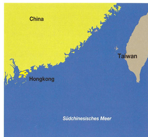
Hongkong und Taiwan.

kratisierung des kommunistischen Riesenreichs sowie die Beendigung der Gewaltdrohungen. Obwohl der Inselstaat faktisch unabhängig ist und über 80 Prozent der jüngeren Menschen dies auch offiziell einfordern, geht sie diesen Schritt nicht; Peking würde dies als «ultimative Provokation» und als Kriegserklärung werten. Da eine friedliche Verständigung unmöglich erscheint, erhöht Peking auf verschiedenste Weise den Druck auf Taipeh. Ohnehin ist man dort zu sechzig Prozent wirtschaftlich von Festland-China abhängig (umgekehrt ist dieses in seiner Spitzentechnik von Taiwan). Die häufigen Verletzungen des Luftraumes Tai-