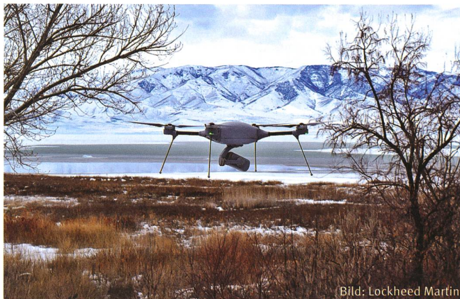
Mit ihrer führenden Ausdauer und schnellen Einsatzfähigkeit ist die Indago 3 von Lockheed Martin ein militärisches, allwettertaugliches, unbemanntes Quadrotor-Flugzeugsystem der Gruppe 1.

schliesslich digitaler Geländehöhenlagedaten (digital terrain elevation data: DTED), und Geofencing umfasst.