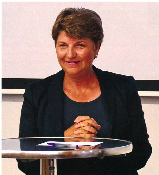
Die Chefin VBS, Viola Amherd, am Kick Off «FiT Frauen im TAZ» in der Guisan Kaserne Bern.

rede. «Am 16. Februar des laufenden Jahres hielten wir eine kleine Gründungsfeier mit 13 Mitgliedern in Bern ab. Sieben Monate später zählen wir im TAZ stolze 72 Frauen und starten in Anwesenheit