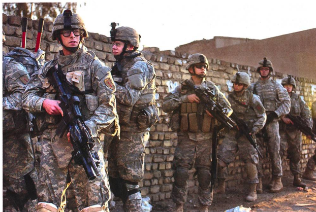
Die US-Streitkräfte sollen in den nächsten drei Jahren vollständig aus dem Irak abgezogen werden.

NATO, für das gesamte Bündnis.» Es gebe aktuell im deutsch-amerikanischen Verhältnis den «einen oder anderen schrilleren Ton». Die NATO, so die Ministe-