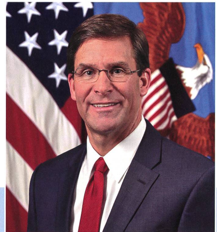
US-Verteidigungsminister Mark Esper.