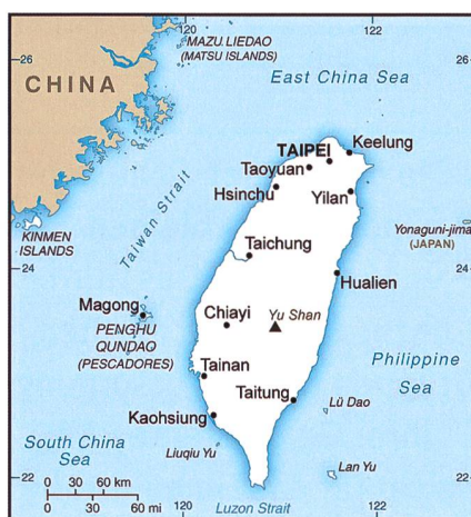
Taiwan im Zentrum der chinesischen und US-amerikanischen Sicherheits- und Militärpolitik.

Nach der gegenseitigen Schliessung von Konsulaten in den USA und China im Juli 2020 sind die chinesisch-amerikanischen Beziehungen auf einem Tiefpunkt angelangt. Der Ausgangspunkt des Konflikts zwischen den USA und China war der von der US-Regierung initiierte Wirtschafts- und Handelskrieg, der unter anderem zu Sonderzöllen auf Waren im dreistelligen Milliardenbereich geführt hat. Daneben streiten die beiden Regierungen sich über den Ursprung des Coronavirus, über den Technologiekonzern Huawei, über die politische Lage in Hongkong und die Unterdrückung der Menschenrechte, unter anderem im chinesischen Landesteil Xinjiang. Daneben bewertet die US-Regierung die Machtpolitik Chinas im Asien-Pazifikraum rund um Taiwan als aggressiv. Auf Manöver der