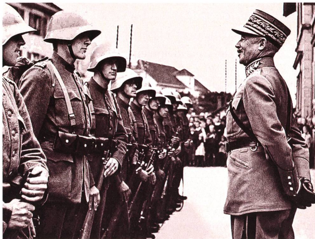
Das freundliche Wort bei der Inspektion wird der Soldat nicht vergessen.

schen kümmern, der mit ihnen umzugehen hat.» Das Ziel müsse sein, die Verbundenheit ausserhalb des Dienstes aufrecht zu erhalten. Nichts solle im zivilen Leben vorkommen, von dem der Kommandant nichts weiss, vor allem nicht, wenn es sich um Schlimmes handelt. Die Kompanie sei sozusagen nicht entlassen, sondern habe nur die Bewilligung, während 11 Monaten und 17 Tagen Zivil zu tragen. Die militärische Einteilung müsse im Zivilleben weiter dauern «als praktische Verwirklichung jener im Dienst so viel gerühmten Kameradschaft». «Was gepflegt und entwickelt werden muss, ist das «soldatische Herz»; das will sagen, der Offizier muss seine Leute lieben und sich ihre Zuneigung erobern.»