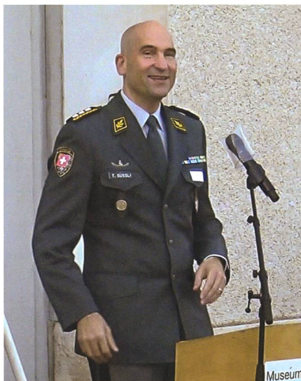
KKdt Thomas Süssli: Zufrieden mit dem Corona-Einsatz seiner Truppen.