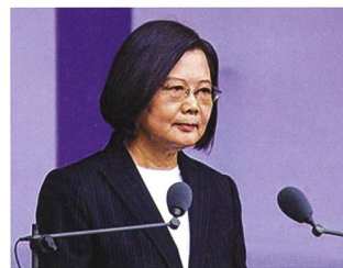
Taiwanesische Staatspräsidentin Tsai.

Inmitten von Spannungen mit China hatte die US-Regierung im Oktober einem milliardenschweren Rüstungsgeschäft mit Taiwan zugestimmt.