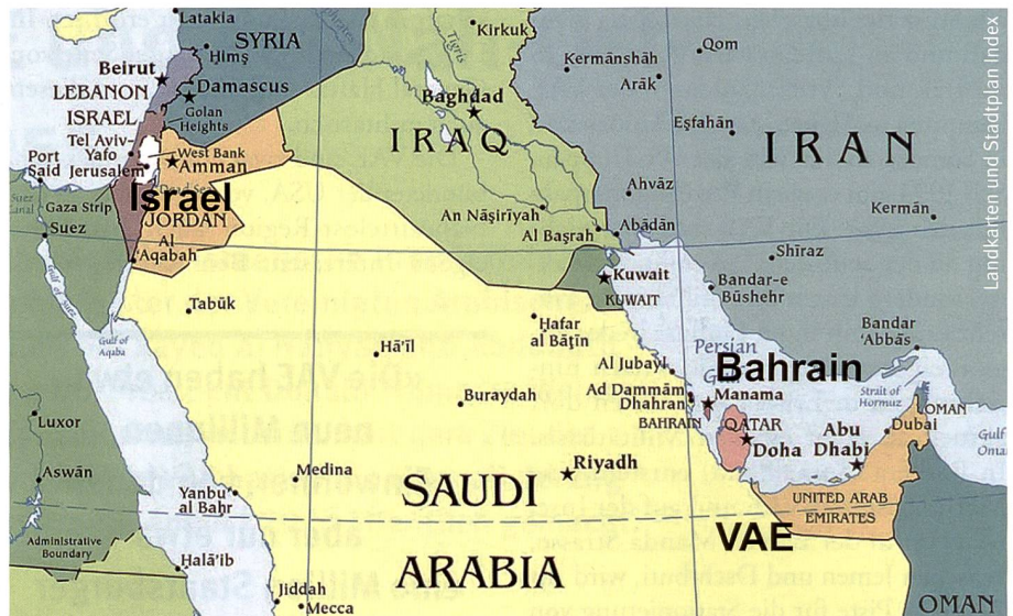
Israel, Bahrain und die VAE.

Am 13. August 2020 kam es schliesslich zur sogenannten «Abraham Vereinbarung», offiziell bezeichnet als «Joint Statement of the United States, the State of Israel and the United Arab Emirates». In diesem überraschenden Durchbruch in einem Telefongespräch des israelische Regierungschefs Benjamin Netanyahu und des Kronprinzen von Abu Dhabi, Scheich Mohammed bin Zayed Al Nahyan, «agreed to the full normalization of relations between Israel and the United Arab Emirates». Präsident Trump twitterte: «Ein historisches Friedensabkommen zwischen unseren guten Freunden, Israel und den Vereinigten Arabischen Emiraten!» Laut einer vom Weissen Haus verbreiteten gemeinsamen Erklärung werden Israel und die VAE Botschaften im anderen Land eröffnen, Direktflüge aufnehmen und eine Serie von Abkommen über gemeinsame Investitionen unterzeichnen, unter anderem in den Bereichen Tourismus, Technologie und Sicherheit. Im Gegenzug verpflichtete sich Israel, auf die geplante Annexion von Teilen des West-