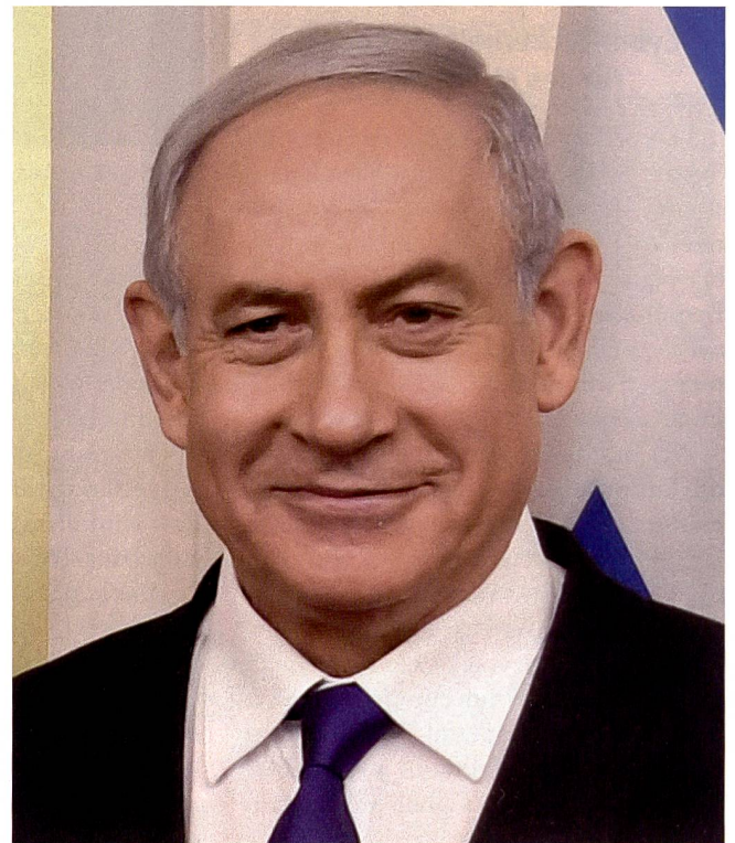
Premierminister Benjamin Netanjahu, Israel.

Seit 1991 sind amerikanische Truppen in den VAE stationiert, und die VAE beteiligten sich an der Seite der Amerikaner am Kampf zur Befreiung Kuwaits,