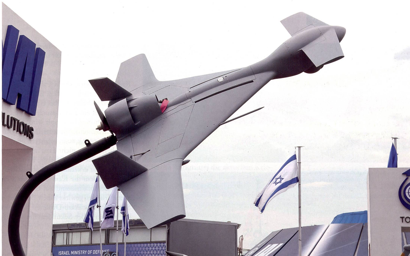
Die israelische Harop-Kampfdrohne wurde von Aserbaidschan eingesetzt.

kaukasus eine realpolitische Machtpolitik jenseits westlicher Konfliktlösungsmechanismen, auf Kosten der Einwohner von Bergkarabach und mit dem Risiko, die politische Stabilität im Südkaukasus dauerhaft zu gefährden. So werfen viele Aserbaidschaner ihrem Präsidenten vor, dass nun wieder russische Truppen in ihrem Land stationiert sind. 6