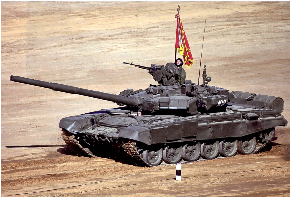
Die armenischen Truppen sollen über 185 Panzer durch Drohnenbeschuss verloren haben.