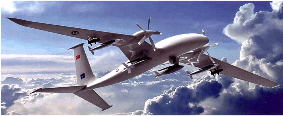
Die türkische Kampfdrohne Bayraktar hat den Krieg für Aserbaidschan mit entschieden.