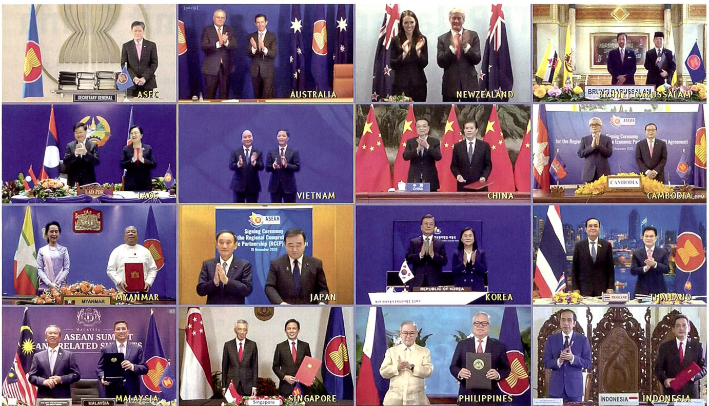
Das RCEP wird unterzeichnet.