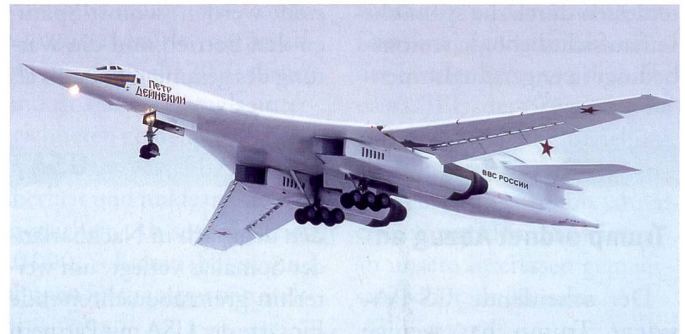
Tu-160M Igor Sikorsky.