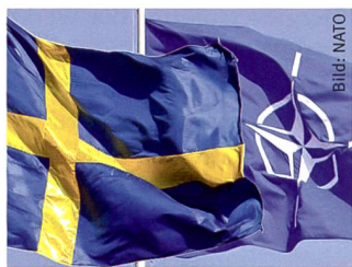
Eine Anbindung zur NATO scheint in Schweden möglich.

Nachdem im Parlament die Schwedendemokraten ihre Haltung zum Militärbündnis geändert haben, ist in Schweden erstmals eine Mehrheit für einen NATO-Beitritt vorstellbar. Konkret geht es bei dem Geschäft um eine sicherheitspolitische Allianzoption. Das heisst, Schweden würde zu einem noch zu definierenden «si-