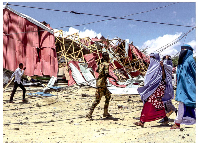
Fragile Lage in Somalia.

Weiter soll die Zahl der US-Soldaten im Irak und in Afghanistan auf jeweils 2500 reduziert werden. Für Deutschland hatte das Pentagon bereits Ende Juli 2020 eine Verringerung der Truppenstärke