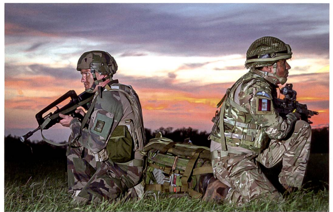
Halten sich den Rücken frei: britische und französische Fallschirmjäger.