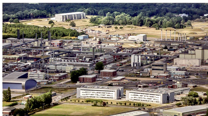
AWE Standort in Aldermaston, Südengland.

Unabhängig der Brexit-Regelungen hat die britische Regierung im Dezember bekannt gemacht, die Aufsicht und Kontrolle über das Atomwaffeninstitut (Atomic Weapons Establishment/AWE) wieder zu übernehmen. Das AWE ist für sämtliche Atomwaffen des Königreichs zuständig. Es entwickelt, wartet und würde deren Einsatz unterstützen. Derzeit wird das Institut von den Rüstungsunternehmen Serco,