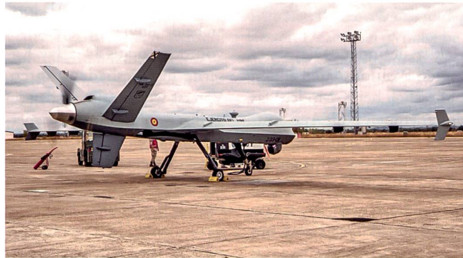
Spanische MQ-9 Reaper Drohne.

Ende November 2020 wurden an Spanien die letzten zwei MQ-9A Reaper Drohnen ausgeliefert. Damit verfügt das Königreich als erstes Land ausserhalb der USA über eine einsatzfähige Drohnenplattform dieser Art. Insgesamt wurden vier Flugzeuge und drei Bodenstationen des neusten Entwicklungsschritts (Block 5) bestellt. Die ersten beiden Geräte kamen bereits im Januar 2020 auf die Halbinsel. Der Ejército del Aire konnte unterdessen durch die spanische Luftaufsichtsbehörde (coronabedingt in enger Zusammen-